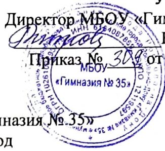
ГРАФИК питания обучающихся МБОУ «Гимназия № 35» на 2023-2024 учебный год